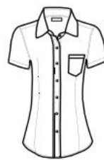
BLUSA MODERN FIT MANGA CORTA MODERN FIT SHIRT SHORT SLEEVE