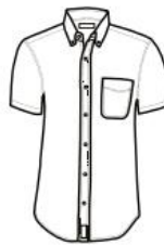
CAMISA MODERN FIT MANGA CORTA MODERN FIT SHIRT SHORT SLEEVE