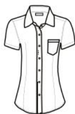
BLUSA MODERN FIT DE MEZCLILLA MANGA CORTA MODERN FIT SHIRT DENIM SHORT SLEEVE