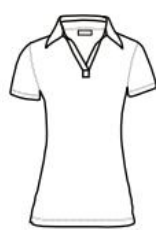
POLO SLIM FIT MANGA CORTA SLIM FIT POLO SHORT SLEEVE

50% ALGODÓN / COTTON 50% POLIÉSTER / POLYESTER