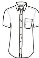
CAMISA MODERN FIT DE MEZCLILLA MANGA CORTA MODERN FIT SHIRT DENIM SHORT SLEEVE