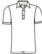
POLO SLIM FIT MANGA CORTA SLIM FIT POLO SHORT SLEEVE