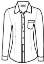
BLUSA MODERN FIT MANGA LARGA MODERN FIT SHIRT LONG SLEEVE

60% ALGODÓN / COTTON 40% POLIÉSTER / POLYESTER