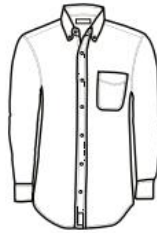
CAMISA MODERN FIT MANGA LARGA MODERN FIT SHIRT LONG SLEEVE