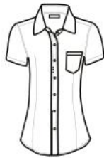
BLUSA MODERN FIT MANGA CORTA MODERN FIT SHIRT SHORT SLEEVE