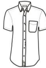
CAMISA MODERN FIT MANGA CORTA MODERN FIT SHIRT SHORT SLEEVE