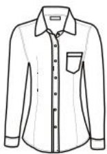
BLUSA MODERN FIT DE MEZCLILLA MANGA LARGA MODERN FIT SHIRT DENIM LONG SLEEVE