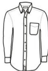
CAMISA MODERN FIT DE MEZCLILLA MANGA LARGA MODERN FIT SHIRT DENIM LONG SLEEVE